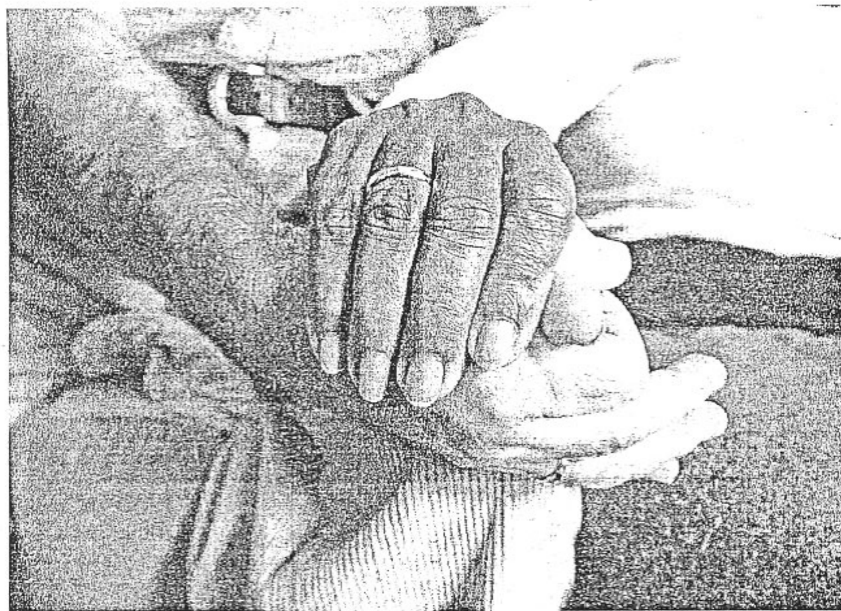
ALIANZAS. Se conocieron en la agencia, estuvieron un año de novios y acaban de casarse.

Los dos aseguran que ha sido el año más feliz de su vida y «pedimos a Dios que siga como hasta ahora». Hace apenas un mes que se han casado, el 13 de septiembre, y han viajado de luna de miel a Venecia. «Me daba miedo el avión -sostiene él-, pero ha merecido la pena».