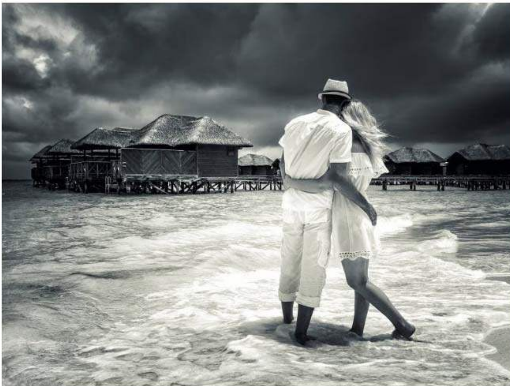
Una pareja avistando una tormenta de verano